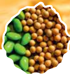
* Семена сои ультра ранних сортов от 85 дней