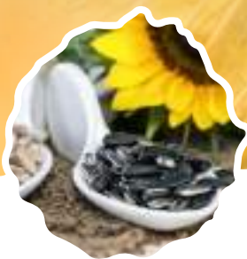
* Семена подсолнечника срок созревания от 90 до 120 дней