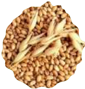
* Семена ячменя отечественной и импортной селекции