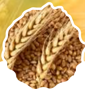
* Семена яровой пшеницы отечественной и импортной селекции