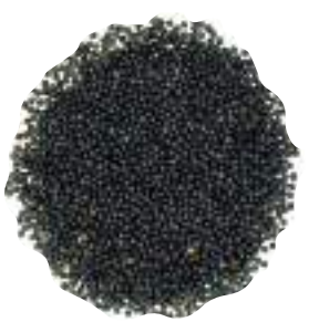
* Семена рапса в том числе высокоолеинового