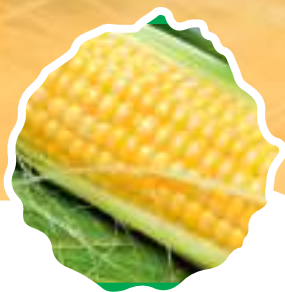
* Семена кукурузы ФАО от 150 до 250

С 2005 года наша компания успешно работает на рынке поставок российским сельхозпроизводителям высокопродуктивных семян, биопрепаратов и агрохимикатов. Компания реализует семена только от производителей-оригинаторов, тем самым исключая малейшую возможность фальсификации продукции. ГК «РусАгроНова» – официальный дистрибьютор компаний: «СААТБАУ РУС», «ФГБНУ ВНИИ кукурузы г. Пятигорск», «РОСАГРОТРЕЙД», RAGT, BREVANT.