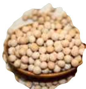
* Семена гороха отечественной и импортной селекции различного направления